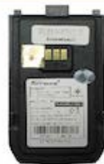
Battery 1200 mAh.